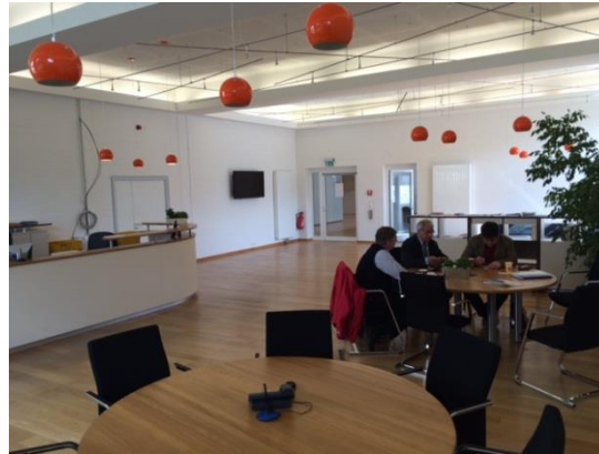
Empfangsbereich Haus U