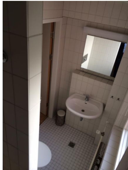
Bad 2 (im Zimmer)