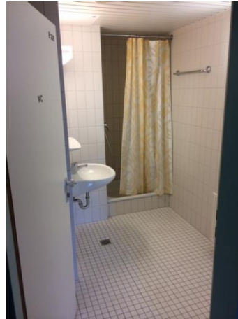
Bad 1 (neben dem Zimmer)