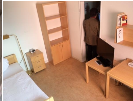
Raum 3 (Dozentenzimmer)