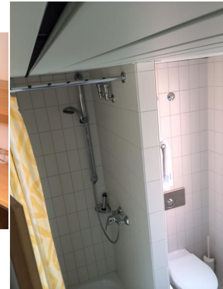
Bad für den Dozenten